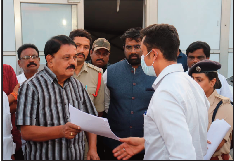
ఈ సభను కనీవినీ ఎరుగని రీతిలో నిర్వహించి, భారీ ఎత్తున ప్రజలను సమీకరించాలని పార్టీ నాయకులు, కార్యకర్తలకు పిలుపునిచ్చారు. ప్రతి ఒక్కరూ సమన్వయంతో పనిచేసి కార్యక్రమాన్ని విజయవంతం చేయాలని కోరారు.