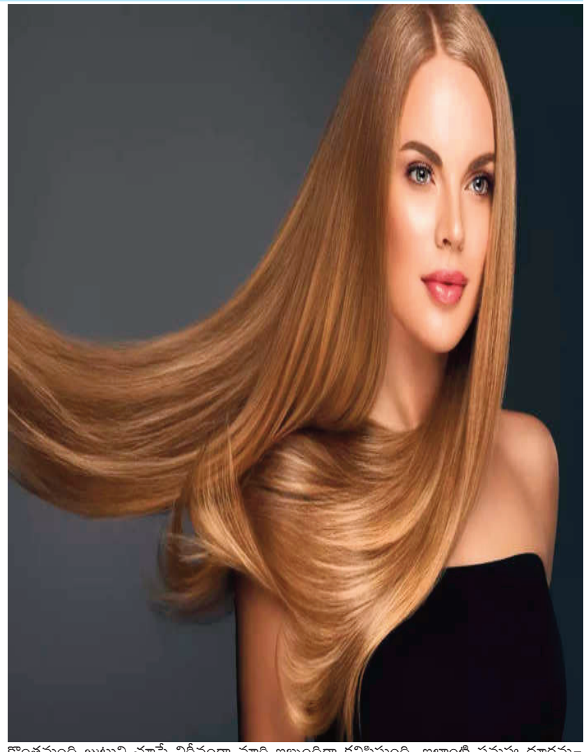
కొంతమంది జుట్టుని చూస్తే నిర్ద్వందంగా మారి ఇబ్బందిగా కనిపిస్తుంది. ఇలాంటి సమస్య దూరమయ్యేందుకు, జుట్టు మృదువుగా మారేందుకు కర్పూర నూనె బాగా హెల్ప్ అవుతుంది.

ఎలా వాడాలి.. మీకు ఎంత నూనె అవసరమో అది తీసుకుని అందులో ఒకటి లేదా రెండు కర్పూర బిళ్లను వేయాలి. మొత్తం కరిగాక దానిని జుట్టుకి అప్లై చేయాలి. దీని వల్ల తల చల్లగా అనిపిస్తుంది. స్కాల్ప్ సున్నితంగా మారతుంది. అలా రాతాక.. 4 గంటలు వీలైతే రాత్రంతా ఉంచండి. ఇలా వారానికి 2 నుంచి 3 సార్లు చేయండి. దీంతో బెస్ట్ ఔట్ ఫిట్స్ మీ సొంతమవుతాయి.