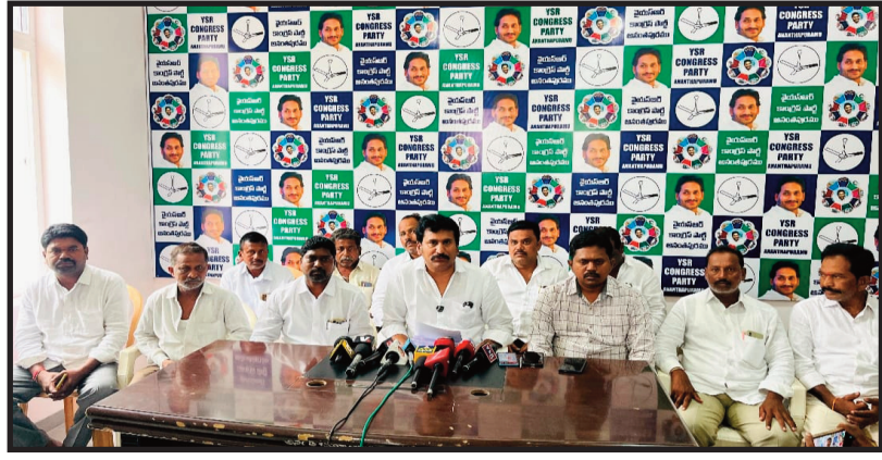
ప్రభుత్వాన్ని నిలదీస్తూ బాధితుల వక్షాన నిలబడడంతో ప్రభుత్వానికి కంటకప్రాయంగా మారారు.