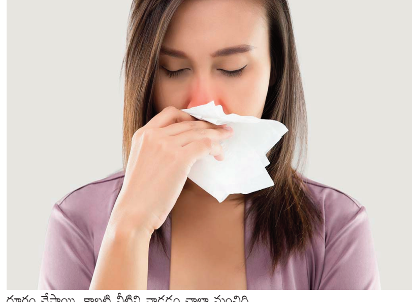
దురం చేస్తాయి. కాబట్టి వీటిని వాడడం చాలా మంచిది. క్లీన్ చేయండి..

సింగిల్ డిస్పోజబుల్ వైప్స్ వంటి వాటికి దుమ్ము త్వరగా ఆకర్షిస్తాయి. అందుకే వీటిని వాడక మట్టి వాడకపోవడమే మంచిది. ఇవి తక్కువ ధరకే లభించడమే కాకుండా క్రిములని కూడా