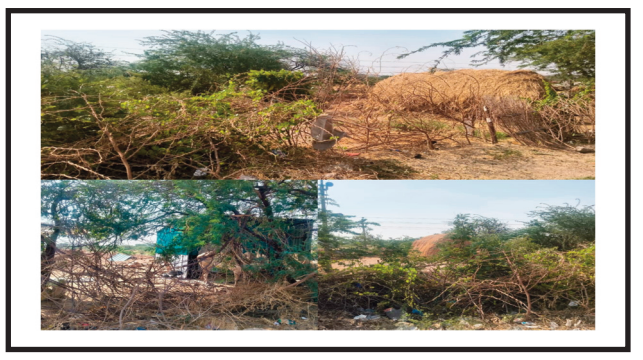
ఆదోని, మే 4 (అనంత ప్రభ) ఆదోని మండలం పెద్ద తుంటలం గ్రామంలోని సర్వే నెంబర్ 360/బి లో ఉన్న ప్రభుత్వ భూమిని కొంతమంది కట్టారులు అక్రమంగా ఆక్రమించుకున్నారని గ్రామ ప్రజలు తీవ్ర ఆగ్రహం వ్యక్తం చేస్తున్నారు. ఈ విషయంపై ఇప్పటికే +నా ద్వారా ఫిర్యాదు చేసినప్పటికీ, ఇప్పటివరకు ప్రభుత్వం గాని, సంబంధిత అధికారులు గాని ఎలాంటి చర్యలు తీసుకోలేదని ఆవేదన వ్యక్తం చేశారు. ఎమ్మార్సీ కార్యాలయం, పిఆర్సీ కార్యాలయాల చుట్టూ పలుమార్లు తిరిగినా సమస్య పరిష్కారం కాలేదని తెలిపారు. ప్రభుత్వ భూమిని కాపాడాలని చేతులు జోడించి వేడుకున్న ఎవరూ స్పందించలేదని మండిపడ్డారు. కట్టారుల నుంచి భూమిని స్వాధీనం చేసుకుని తిరిగి ప్రభుత్వ ఆధీనంలోకి తీసుకురావాలని గ్రామ ప్రజలు డిమాండ్ చేస్తున్నారు. ప్రభుత్వం లేదా అధికారులు తక్షణ చర్యలు తీసుకోకపోతే న్యాయపోరాటానికి దిగుతామని హెచ్చరించారు. అపసరమైతే గ్రామ ప్రజలమే ముందుకు వచ్చి పోరాటం చేసి ప్రభుత్వ భూమిని కాపాడుకుంటామని స్పష్టం చేశారు. ఎల్లీ పరిస్థితుల్లోనూ ప్రభుత్వ భూమిని కాపాడాల్సిందేనని గ్రామ ప్రజలు ఒకసారిగా నివించారు.