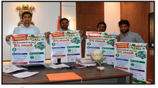
పుట్టపర్తి మే 4 (అనంత ప్రభ) కలెక్టర్ ఛాంబర్ల నందు గ్రామీణ ప్రజలు తమ ఇంటి పన్ను సకాలంలో చెల్లించి ప్రభుత్వం కలిగిస్తున్న 5% రాయితీని సద్వినియోగం చేసుకోవాలని జిల్లా కలెక్టర్ శ్యామ్ ప్రసాద్ కోరారు. ఇందుకు సంబంధించిన పోస్టర్లను సోమవారం ఆయన అభివృద్ధించారు. 2026-27 ఆర్థిక సంవత్సరానికి సంబంధించి మే 31 లోపు పన్ను చెల్లించే వారికి మాత్రమే ఈ రాయితీ వర్తిస్తుంది. ఈ 5% తగ్గింపు కేవలం ప్రస్తుత సంవత్సర పన్నుకు మాత్రమే. పాత టాకీలకు లేదా యూజర్ డాబ్బిలకు వర్తించదు.