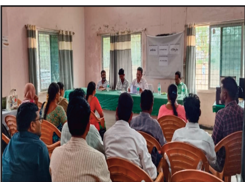
జి ఎస్ డబ్ల్యూ అధికారి పంచాయతీ సెక్రటరీలు, సచివాలయ అధికారులపై ఆగ్రహం వ్యక్తం చేశారు. అలాగే ప్రభుత్వం ద్వారా గ్రామ సచివాలయంలో వివిధ శాఖలకు సంబంధించిన అధికారులు గ్రామ ప్రజలకు ప్రభుత్వ సర్వీసులు (సేవలు) సక్రమంగా అందడం లేదని మీ సమాధానాల్లోనే తేలితెల్లమవుతుందని మరీ పంచాయతీ సెక్రటరీలు ఏం చేస్తున్నారని ప్రజలకు

ప్రభుత్వ సేవలు అందించడంలో విఫలమైతే మాత్రం చర్యలు తప్పవని హెచ్చరించారు. అదేవిధంగా మండల వ్యాప్తంగా ఉన్నటువంటి గ్రామ సచివాలయాల్లో కూడేరు-1, కూడేరు-2, పి. నారాయణపురం, మరుట్ల సచివాలయాల పరిధిలో వార్డుల్లోనే హౌస్ హోల్డ్ మ్యాపింగ్ 71 శాతం పురోగతి సాధించడం పై వారిని అభినందించగా మిగతా గ్రామ సచివాలయంలో ఇప్పేరు, గొటుకూరు, సర్వేల యొక్క పురోగతి అధ్యానంగా ఉందని ఆయా పంచాయతీ సెక్రటరీల పై జిఎస్ డబ్ల్యూ జిల్లా అధికారి ఆగ్రహం వ్యక్తం చేశారు. అలాగే గ్రామ సచివాలయ పరిధిలోని వార్డులో హౌస్ హోల్డ్ మ్యాపింగ్ సక్రమంగా చేయకపోతే భవిష్యత్తులో ప్రభుత్వ పథకాలు అందకుండా ఆయా గ్రామాల్లో వార్డుల్లో ప్రజలు నష్టపోవడం జరుగుతుందని గ్రామ సచివాలయంలో పంచాయతీ సెక్రటరీ గానీ, సచివాలయ అధికారులు కానీ, ప్రభుత్వ సేవలు ప్రజలకు అందించడంలో నిర్లక్ష్యం వహిస్తే చర్యలు తప్పవని అదేవిధంగా గ్రామ సచివాలయాల పరిధిలో ప్రభుత్వం నిర్దేశించిన పురోగతి సాధించలేకపోవడంపై గ్రామ సచివాలయాల పర్యవేక్షణ అధికారిగా ఎంపీడీవో ఏం చేస్తున్నారని ఎంపీడీవో పై తీవ్ర స్థాయిలో మండిపడ్డారు. వార్డ్ హౌస్ హోల్డ్ మ్యాపింగ్ పురోగతి, ప్రభుత్వం నిర్వహిస్తున్న సర్వేలపై పురోగతి సక్రమంగా లేకపోతే మాత్రం సంబంధిత మండల అభివృద్ధి అధికారి పై మరియు గ్రామ సచివాలయ పంచాయతీ సెక్రటరీలపై చర్యలు తప్పవని జి ఎస్ డబ్ల్యూ జిల్లా అధికారి హెచ్చరించారు. ఈ సమావేశంలో జి ఆర్ డబ్ల్యూ జిల్లా అధికారి నసరా రెడ్డి, జిల్లా కోఆర్డినేటర్ ధనుంజయ, మండల జి ఎస్ డబ్ల్యూ అధికారి జిలాన్ భాష పాల్గొన్నారు