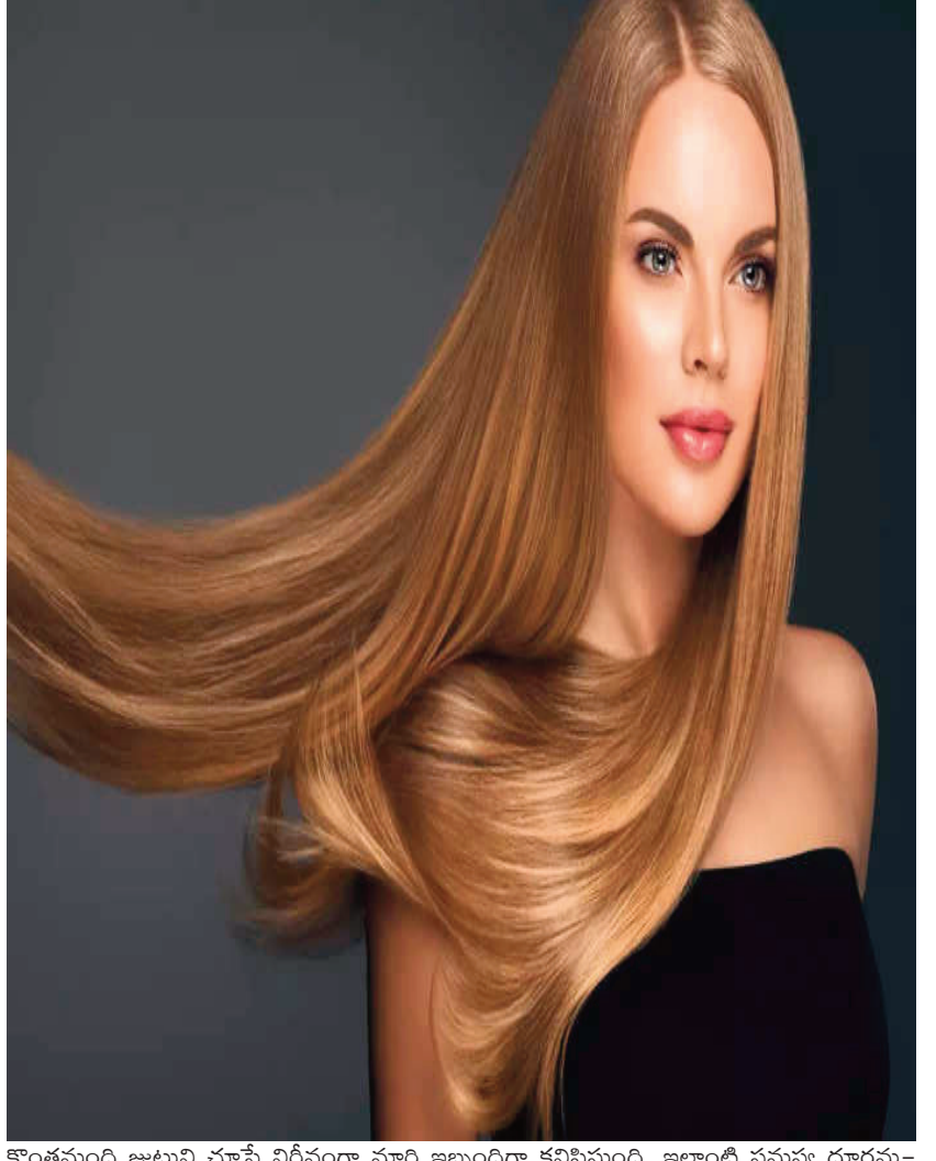
కొంతమంది జుట్టుని చూస్తే నిర్దిష్టంగా మారి ఇబ్బందిగా కనిపిస్తుంది. ఇలాంటి సమస్య దూరమయ్యేందుకు, జుట్టు మృదువుగా మారేందుకు కర్పూర నూనె బాగా హెల్ప్ అవుతుంది.

ఎలా వాడాలి.. మీకు ఎంత నూనె అవసరమో అది తీసుకుని అందులో ఒకటి లేదా రెండు కర్పూర బిళ్ళలను వేయాలి. మొత్తం కరిగాక దానిని జుట్టుకి అప్లై చేయాలి. దీని వల్ల తల చల్లగా అనిపిస్తుంది. స్కాల్ప్ సున్నితంగా మారతుంది. అలా రాశాక.. 4 గంటలు వీలైతే రాత్రంతా ఉంచండి. ఇలా వారానికి 2 నుంచి 3 సార్లు చేయండి. దీంతో బెస్ట్ బెనిఫిట్స్ మీ సంతోషమవుతాయి.