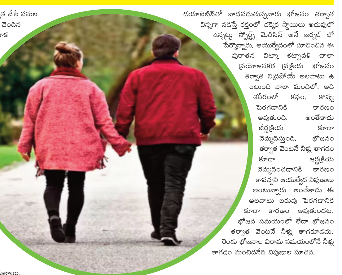
దయాబెటీస్ తో బాధపడుతున్నవారు భోజనం తర్వాత చిన్నగా నడిస్తే రక్తంలో చక్కెర స్థాయిలు అదుపులో ఉన్నట్లు సాస్ట్రీ మెడిసిన్ అనే జర్నల్ లో పేర్కొన్నారు. ఆయుర్వేదంలో సూచించిన ఈ పురాతన చిట్కా శట్కర్మాపథి చాలా ప్రయోజనకర ప్రక్రియ. భోజనం తర్వాత నిద్రపోయే అలవాటు ఉంటుంది చాలా మందిలో. అది శరీరంలో కఫం, కొవ్వు పెరగడానికి కారణం అవుతుంది. అంతేకాదు జీర్ణక్రియ కూడా నెమ్మదిస్తుంది. భోజనం తర్వాత వెంటనే నీళ్లు తాగడం కూడా జీర్ణక్రియ నెమ్మదించడానికి కారణం కావచ్చని ఆయుర్వేద నిపుణులు అంటున్నారు. అంతేకాదు ఈ అలవాటు బరువు పెరగడానికి కూడా కారణం అవుతుందట. భోజన సమయంలో లేదా భోజనం తర్వాత వెంటనే నీళ్లు తాగకూడదు. రెండు భోజనాల విరామ సమయంలోనే నీళ్లు తాగడం మంచిదనేది నిపుణుల సూచన.

జీర్ణక్రియను మెరుగు పరుస్తుంది. భోజనం తర్వాత నడిస్తే ఎక్కువ కాలంలను బర్న్ చెయ్యడం సాధ్యమవుతుంది. రక్తంలో చక్కెర స్థాయిలు అదుపులో ఉంటాయి. ట్రైజిజిరాయిడ్స్ నియంత్రించు తోడ్పడుతుంది. తీసుకున్న ఆహారంలోని పోషకాలు కూడా త్వరగా శరీరానికి అందుతాయి.